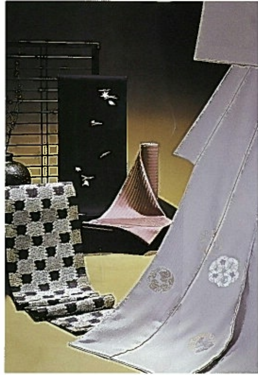
唐織のきもの 七代目 清左衛門

古典モダンをモチーフにローケツ染の技法でデザインから最後の地染めの工程まで仕上げる染色デザイナー奥村石子の世界。