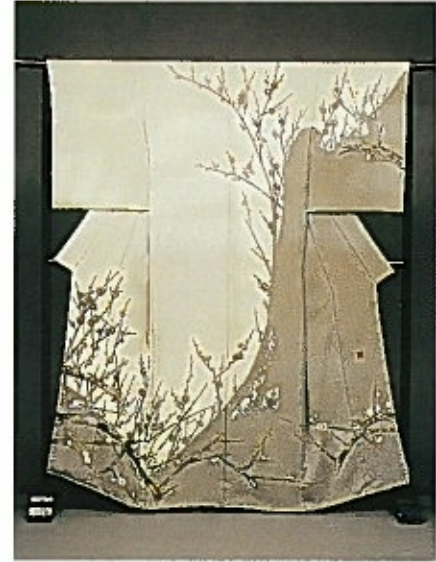
ローケツ染 今昔・観月庵

古典モダンをモチーフにローケツ染の技法でデザインから最後の地染めの工程まで仕上げる染色デザイナー奥村石子の世界。