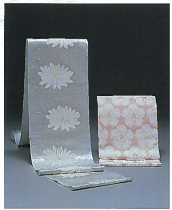
人間国宝 北村 武資